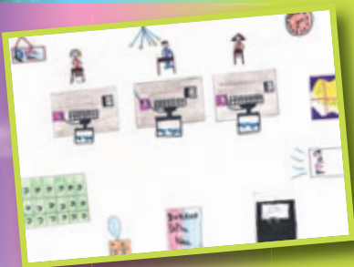
Dessins réalisés par les enfants du personnel DELTA NEU